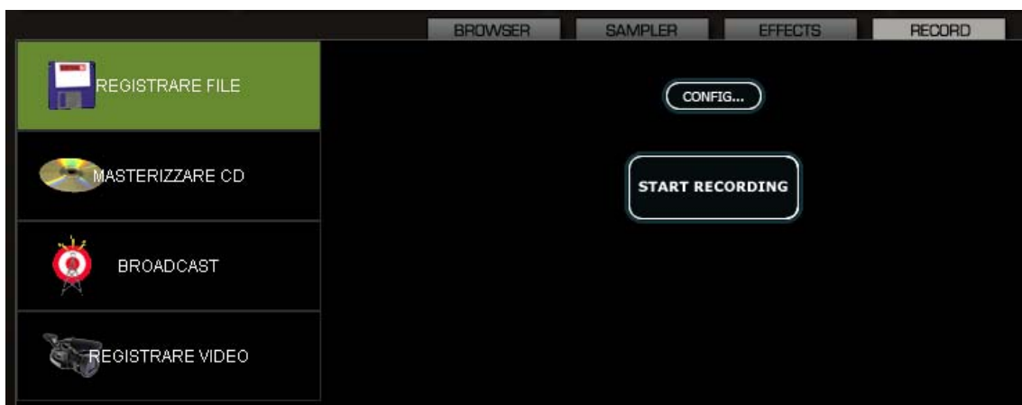
Fig. 2 VirtualDJ Record (sezione)

Cliccare sul menu RECORD e successivamente sul modulo BROADCAST: