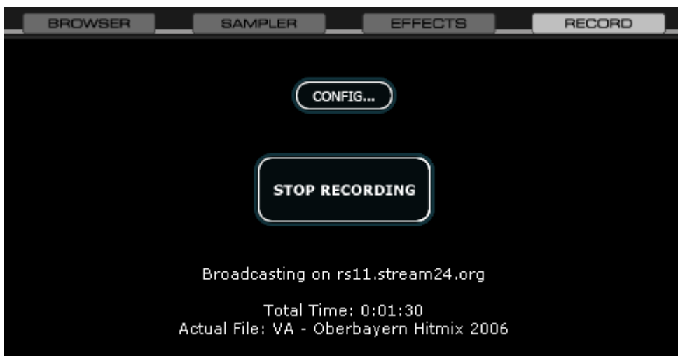
Fig. 5 VirtualDJ Broadcast (Sezione)

Se la connessione allo Streamserver ha avuto successo, vedrà che il contatore inizierà a contare dall'inizio della trasmissione.