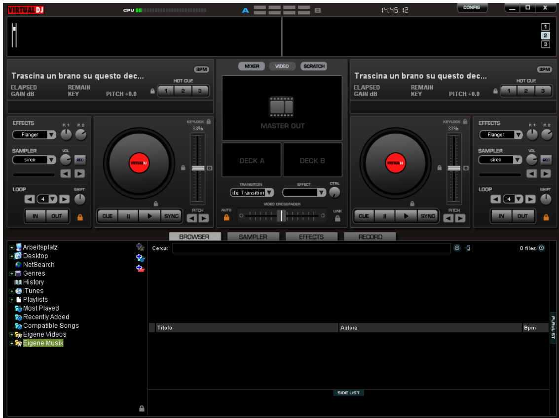
Fig. 1 Immagine d'avvio del VirtualDJ Player

Avviare il Virtual DJ e si vedrà apparire (a seconda del Design di Windows) la seguente finestra: